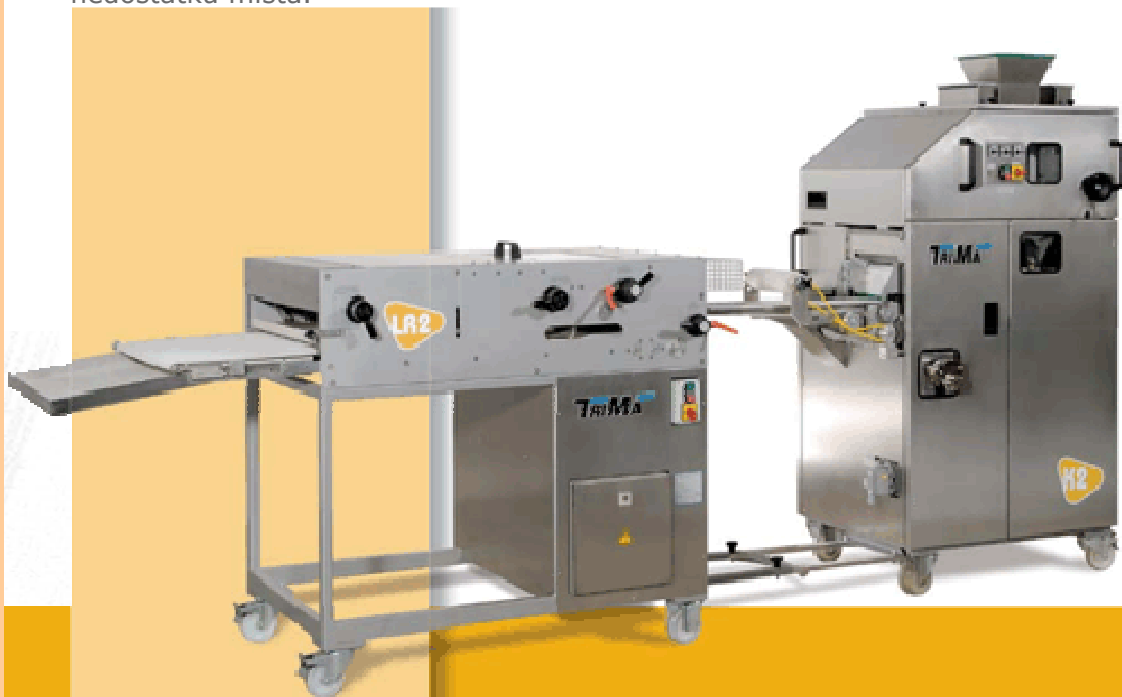
LR2 ve spojení s 2-řádkovou děličkou K2

Technická specifikace může podléhat případné změně.