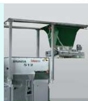
Automatické přivádění těsta