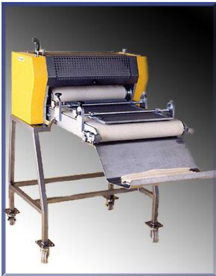
Rollomat s dovalovací deskou Za příplatek, pro větší výrobu vek apod.