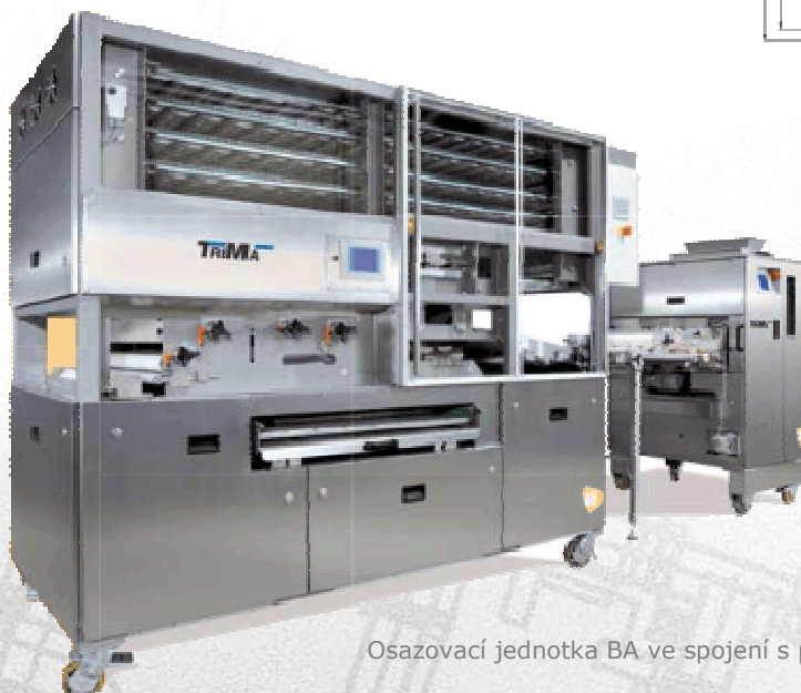
Osazovací jednotka BA ve spojení s předkynárnou G2-3 (3 min. kynutí)

projekty - komplexy • linky - stroje • servis • repase • levnější stroje • ostatní stroje • příslušenství