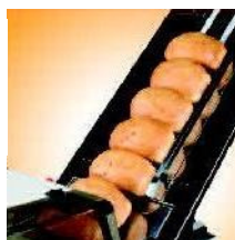
Za příplatek automatický posuv při rozkrájení posledního chleba