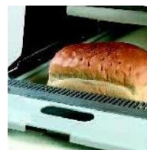
Osazovací rampa na konci pásu pro osazení více chleby