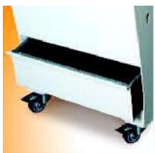
Zachytávání drobků v lehce přístupném šuplíku s velkou kapacitou