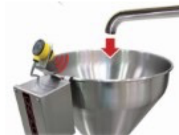
Fotosenzor monitoruje hladinu náplně v násypce a řídí čerpadlo