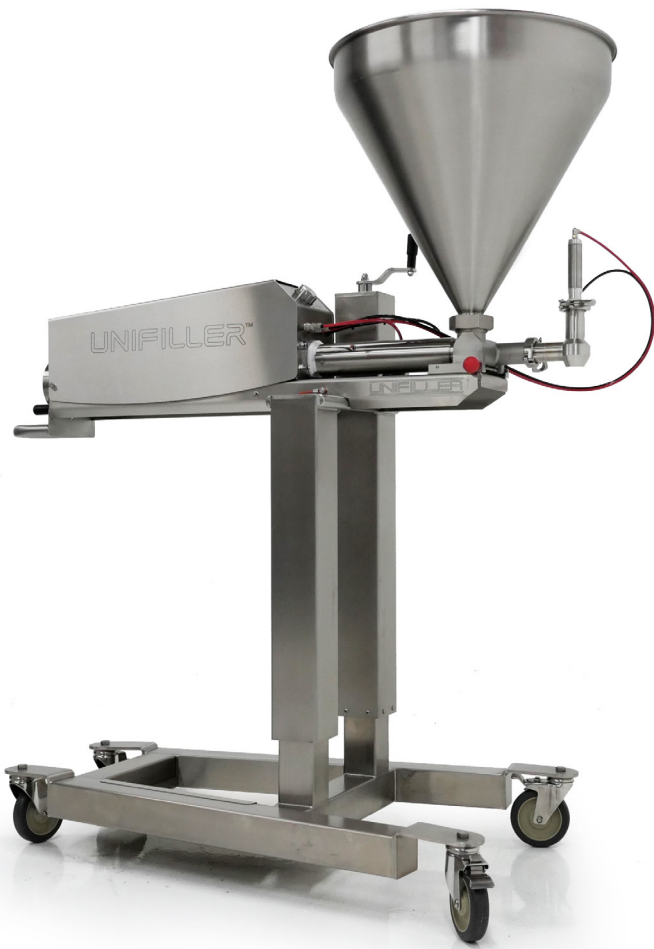
Ilustrační foto; stroj s příslušenstvím

PRO 1000i FS je dokonalým řešením pro nejvyšší hygienické požadavky, kdy je pro použití na dopravním pásu vyžadován dávkovací systém s přesným nastavením výšky. Všechny tekuté hmoty jako dortové směsi, náplně, polévky, saláty, omáčky atd. jsou dávkovány rychle, čistě a s přesnou hmotností. Kromě toho může být PRO 1000i FS vybaven více než 100 různými doplňky, což z něj dělá jeden z nejuniverzálnějších průmyslových dávkovacích systémů.