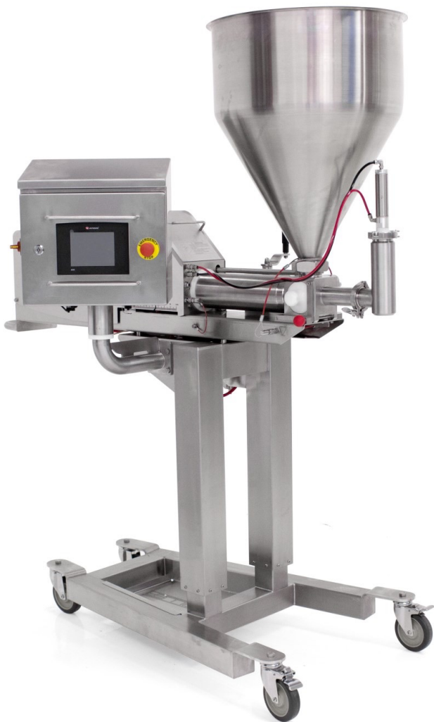
Ilustrační foto; stroj s příslušenstvím