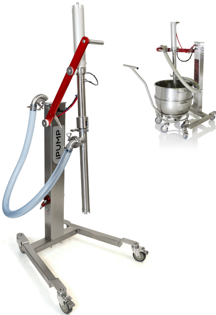
Ilustrační foto; stroj s příslušenstvím

S přečerpávacím čerpadlem iPump zajistíte automatické doplňování násypky vašeho dávkovacího systému a tím výrobu bez přerušení. S naší unikátní technologií čerpání jsou vaše produkty dopravovány do násypky velmi šetrně, aniž by došlo ke snížení kvality.